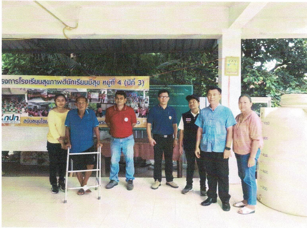
ภาพประกอบโครงการก่อสร้างรางระบายน้ำ ค.ส.ล.ลำเหมืองสาธารณะ บริเวณ ๗-๑๑ ทางหลวงแผ่นดิน หมายเลข ๑๐๗ เชียงใหม่-ฝาง ถึงศาลาเอนกประสงค์ หมู่ที่ ๔